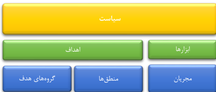
شکل شماره ۲: ویژگی‌های یک سیاست

مطالعات صورت گرفته در زمینه طراحی سیاست‌ها با مواردی از قبیل استفاده از ابزارهای دخیل در سیاستگذاری، غلبه بر میراث سیاست‌های تاریخی انجام گرفته، ماهیت آمیزه‌های دخیل در سیاست و موضوعات پیرامون تدوین سیاست‌ها و ماهیت "طراحی" و "توسعه" در سیاستگذاری همواره دست به گریبان بوده است. اما آنچه که مورد اهمیت است طراحی و تدوین سیاست و سیاستگذاری موفق و اجرای آنها است. از اینرو، چندین معیار اساسی برای یک سیاستگذاری موفق وجود دارد که در دو دسته کلی طبقه‌بندی می‌شوند: مواردی که در آنها طراحی متناسب با بافت و متن سیاستگذاری است و مواردی که به ابزارها و ظرفیت‌های موجود و متناسب با طراحی سیاست مد نظر توجه دارد. این ابزارها و ظرفیت‌ها در واقع امکاناتی است که دولت با توسل به آنها در راستای طراحی و تدوین و اجرای سیاستگذاری‌ها بهره می‌برد. در مجموع پنج ویژگی برای یک سیاست می‌توان برشمرد (Howllet, 2005):